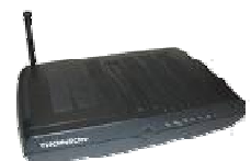
Werkt ook achter een Thomson Experia Box